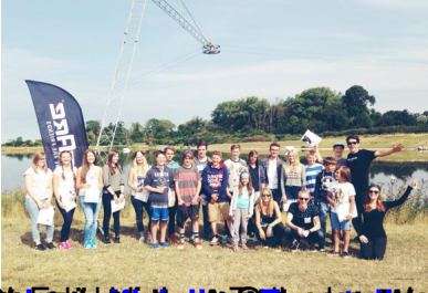
WeAre Youngblood is a great place to meet new friends, to challenge yourself, and to have fun.